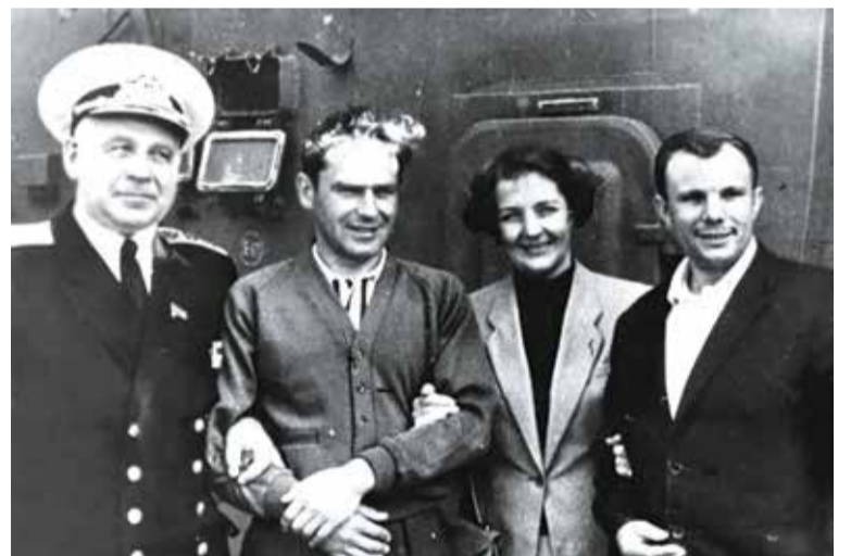
Владимир Касатонов и космонавты Герман Титов и Юрий Гагарин

был принят фрегат «Адмирал флота Касатонов» и на нём гордо взреал бело-голубой Андреевский флаг – символ чести и доблести моряков, защитников Родины, которой все предста-